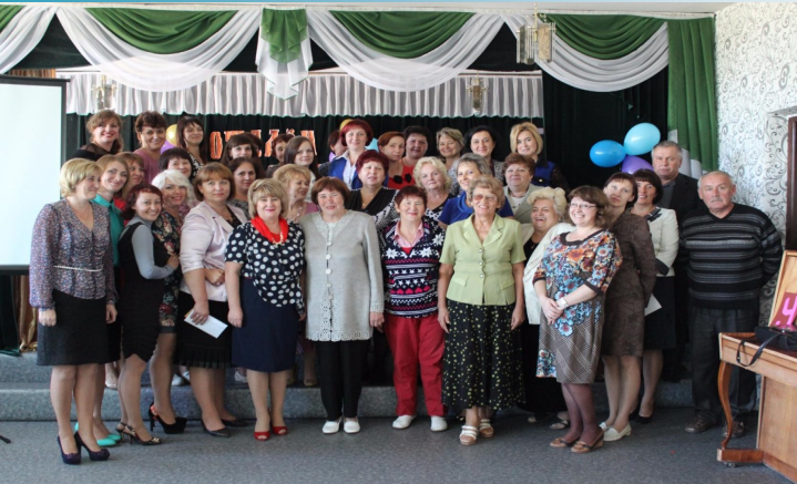
Кваліфікаційний склад учителів школи

Відмінник освіти України, учитель-методист; учитель української мови та літератури вищої категорії; депутат Новгородівської міської ради IV скликань; переможець Всеукраїнського конкурсу «Директор XXI століття—2013»; керує колективом школи з 2000 року